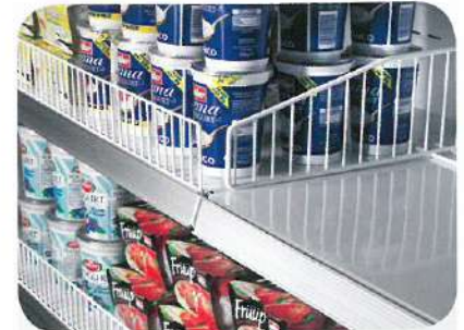
Spondine e divisori in filo. Wire risers and partitions. Balconnets et séparateurs en fil. Frontscheibe und Gittertrennwände. Bordes y tabiques de alambre. Бортики и делители из проволоки.