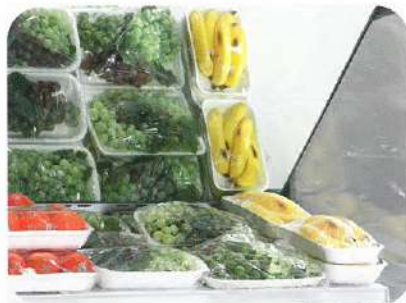
Specchio FV. FV mirror. Spiegel FV. Miroir FV. Espejo FV. Зеркало FV.